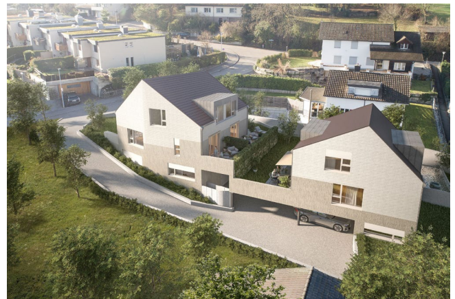
Aussensicht, Buckgass 6

Auf Wunsch vermitteln wir Ihnen auch gerne den Kontakt zu einem ZKB Berater in der Filiale Ihres Wohnorts.