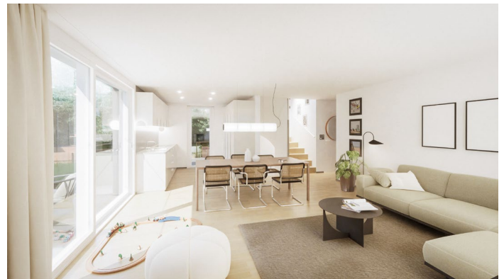
Innenansicht, Buckgasse 6